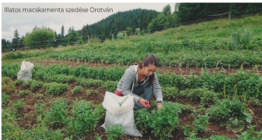
Illatos macskamenta szedése Orotván

A nagyhatalmi pozíciókat korábban több tényező alakította, köztük a világ első (Kolozsvár, 1904.) és második gyógynövénykísérleti intézményének (Budapest, 1915.) megalapítása, a kutatási tevékenység, a hatósági minőségellenőrzés, az ágazathoz kapcsolódó oktatás, ismeretterjesztés, tervszerű gazdálkodás, az import minimálisra szorítása. Ezek a tényezők a rendszerváltozás és az