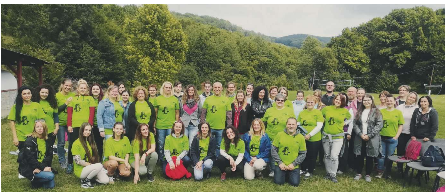
Elsőéves hallgatók szakmai tábora Bükkzentkereszten