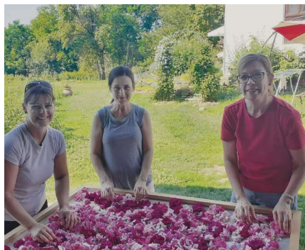
Damaszkuszi rózsza szárítása Szentábrahámon

A szak az agrárképzési terület része. Az ismeretkörök – előírás szerint – modulokra tagolódnak. A közös kompetencia modul munkaerő-piaci ismereteket, informatikai alapismereteket, idegen nyelvet, kommunikációt tartalmaz, míg az agrárképzési terület szerinti közös modul tantárgyai az alapvető, illetve legfontosabb természettudományi, műsza-